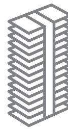
Remboursement de l'assureur